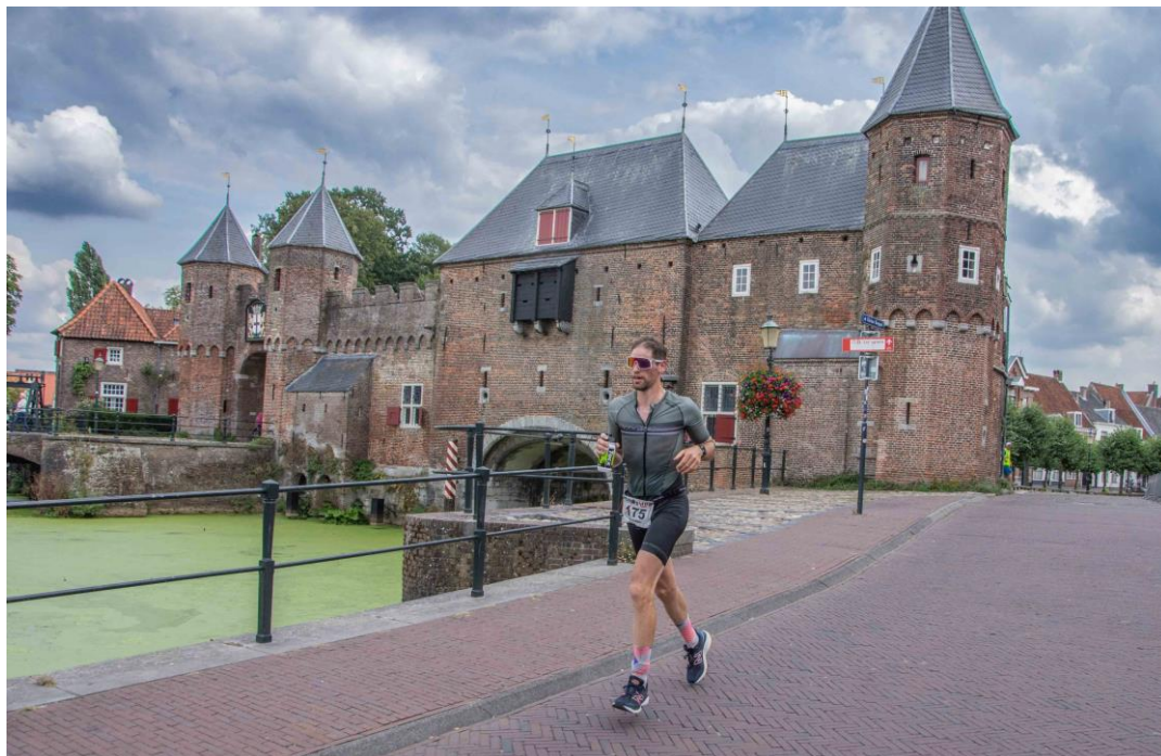
Op zondag 4 september vond voor de zesde keer de Keistad Triathlon plaats. Vanwege blauwalg in de Eem was het onderdeel zwemmen helaas geschrapt.